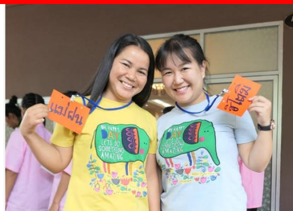
タイで活躍する仁美さん